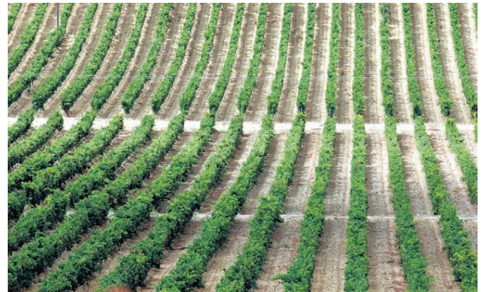
VISTAS Desde el mirador de La Rioja podemos ver los viñedos de Rioja Alavesa.