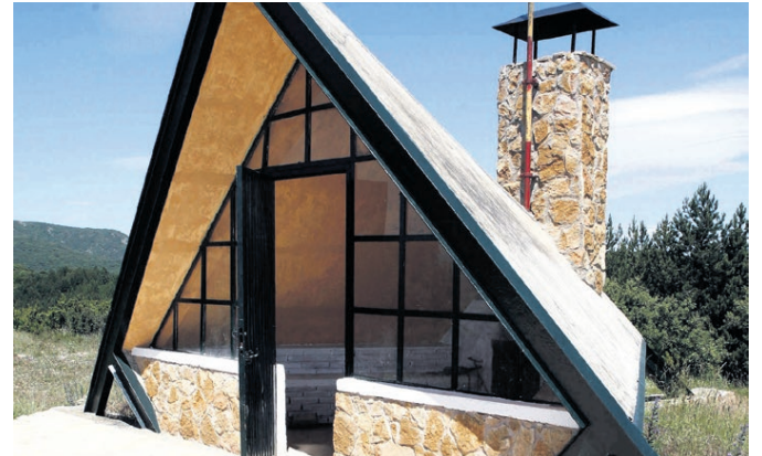
REFUGIO Su curiosa forma lo convierte en una de las atracciones de esta ruta.

Por el camino nos encontramos bosques de encinas , cuyo fruto, la bellota, sirve de alimento a los jabalíes, habituales por estos lares. También encontramos formaciones de pinos silvestres , y algunos madroños y arces .