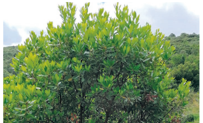
MADROÑO Es uno de los árboles singulares que encontramos en estos lares.