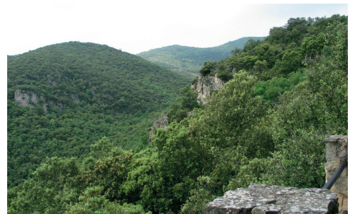
MIXTO Encinas y quejigos se complementan en las laderas.

este tipo de elementos de todo el monte. No es una coincidencia ya que discurren a lo largo de antiguos regatos proporcionando los cuatro elementos básicos para la obtención del hierro: cercanía a los yacimientos metalíferos, presencia de agua, orientación a los vientos dominantes que aportan oxígeno para la combustión de los hornos y abundancia de combustible proveniente de los frondosos bosques, con encinas, arces y quejigos , que crecen en estos húmedos valles al amparo de suelos frescos y profundos. Además la ruta ofrece un atractivo adicional en la meta. En días despejados, el mirador de La Alpargata (847 m) ofrece una de las mejores vistas de toda esta zona y permite divisar el espléndido paisaje de la vega de Miranda de Ebro.