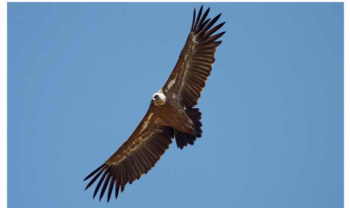
VUELO El buitre leonado y el águila perdicera son habituales de la zona.

A esta especie, ligada a los roquedos calizos y en franca recuperación en la provincia, le corresponde el ingrato papel de limpiar el ecosistema de carroñas, acelerando su incorporación al medio y cerrando así el ciclo de la vida.