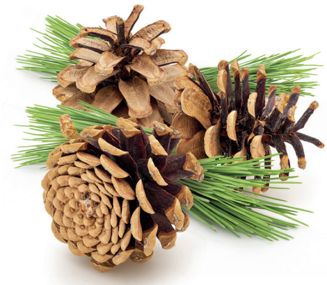
PINOS Silvestre y laricio son las especies más extendidas.

La senda de la Cruz de Motrico sería aún más exigente, sobre todo en días calurosos, sin la sombra de los pinos que flanquean buena parte del camino. El laricio y el silvestre son las dos coníferas más abundantes en el Monte de Miranda. El pino silvestre –especie dominante en comunidades como Castilla y León y Aragón– supera en altura y porte al laricio, y su madera es más apreciada en la fabricación de mobiliario y otras estructuras.