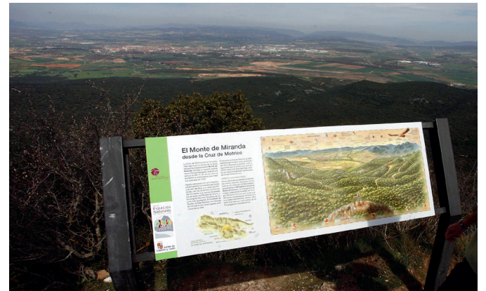
MIRADOR La Cruz de Motrico es la mejor atalaya de la zona.