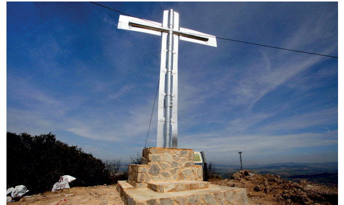
CRUZ Esta estructura corona desde 1955 el Monte de Miranda.