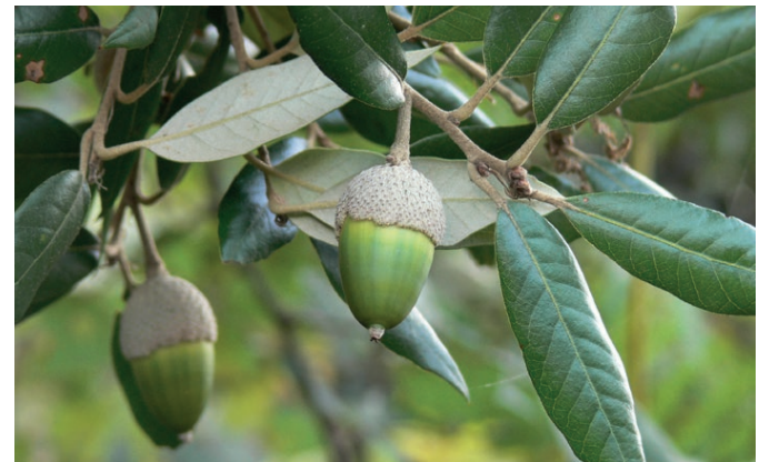
ENCINA Sus bellotas sirven de alimento a los jabalíes.

La senda botánica, como su nombre indica, permite al senderista admirar la flora y fauna que esconde este bello paraje. La riqueza arbórea tiene en la encina a uno de sus mejores exponentes y su fruto, la bellota, representa un auténtico manjar para uno de los habitantes de este entorno: el jabalí. Un fruto diferente (redondo y de color negro azulado cuando madura) identifica al enebro , arbusto que protege sus bayas entre hojas lineales, rígidas y punzantes.