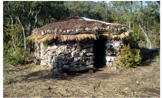
CHOZO DE LOS PASTORES Vestigio del antiguo uso ganadero.

El avistamiento de aves es uno de los atractivos de cualquier paseo por el Monte de Miranda. Más aún si se trata del águila perdicera, una especie protegida por el serio riesgo que existe de que desaparezca de los cielos burgaleses.